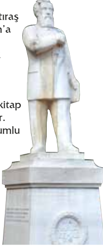
Namık Kemal Heykeli

Hükümet Konağı'nın karşısındaki Namık Kemal Parkı içinde yer alan heykel, Namık Kemal anısına 1949 yılında heykeltıraş Nusret Suman'a yaptırılmıştır. Eserde Namık Kemal'in sağ eli göğsünde durmakta, sol elinde ise bir kitap bulunmaktadır. Tekirdağ doğumlu Namık Kemal, yazdığı roman, şiir ve tiyatro oyunları ile "Vatan Şairi" unvanını almıştır.