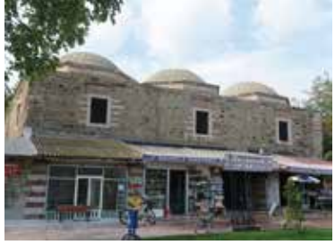
Süleyman Paşa Bedesteni

Şehrin merkezinde bulunan külliyenin cami, hamamı, bedesteni, medresesi ve kitaplığı ayakta. Vaktiyle kervansaray'ı ve imareti olduğu da söylenmektedir. Fakat bugün camii ve bedesteni en iyi durumda olan yapılarıdır.