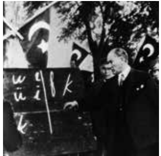
Alfabe karşındayken Mustafa Kemal Atatürk

Daha sonra harf devrimini başlatmak üzere 23 Ağustos 1928 Ertuğrul gemisiyle kıydan Tekirdağ'a gelmiştir. Bu ziyaretinden sonra da 3 Haziran 1936 de Göçmen Köyü inşaatını görmek üzere ve 16-17 Ağustos 1937'de de Büyük Trakya askeri manevraları incelemek için Tekirdağ'ı ziyaret etmiştir.