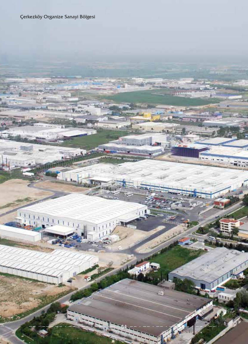
Çerkezköy Organize Sanayi Bölgesi

Sanayinin en yoğun olduđu bölge, Çorlu-Büyükkarıştıran arası Velimeşe, Veliköy, Yulaflı, Türkgücü, Muratlı-Karıştıran yolu ile Çerkezköy Organize Sanayi Bölgesi'dir. Üretimler geri dönüşüm, gıda, beton elemanları, medikal tekstil, prefabrik, tarım makineleri, kablo, bio dizel, hazır yemek, hayvansal gıda sektörleri, tekstil, otomotiv, yedek parça, polyester, kimya, çelik ve bilgisayar sektörleri vb. çok çeşitli alanları kapsamaktadır.