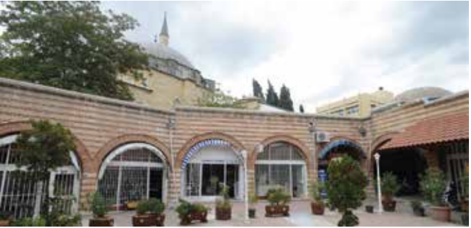
Süleyman Paşa Medresesi