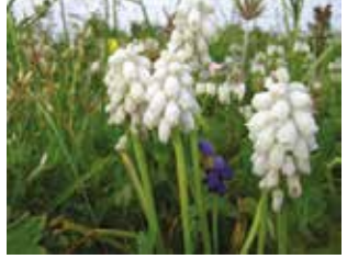
Muskat Üzüümü (Muscari sp.)