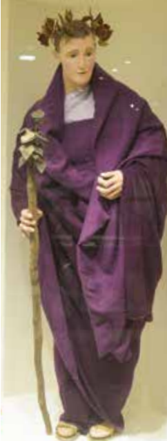
Trak Kralı Kersepletes

Tekirdağ Merkez ve Malkara ,Şarköy İlçelerindeki araştırmalar Tekirdağ'ın Yontma Taş Devri'nden (Paleolitik) itibaren iskan edildiğini göstermektedir. Taş Devri'nden sonra Tunç ve Demir Devirleri'ne ait arkeolojik kalıntıların da tespit edildiği kent, M.Ö. 2. Bin'den itibaren Traklar'ın göçlerine sahne olmuştur. M.Ö. 6. yüzyılda Persler'in istilasına uğramış, aynı yüzyılda Trak boylarından Odrys Krallığı'nın vatani olmuştur. Daha sonra, Makedonyalı'lar, Romalı'lar, Bizanslı'lar ve 1357 yılından itibaren de Osmanlılar'ın egemenlik bölgesine dahil olmuştur.