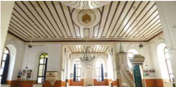
Eski Cami iç mimarisi ve süslemeleri