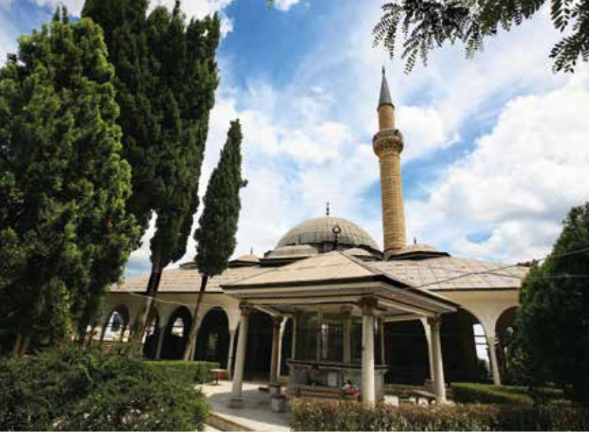
Rüstem Paşa Camisi

Eser; Camisi, Medresesi, Hamamı, Bedesteniyle bir külliye içinde yer alır. Geniş bir avlu içinde olan cami kesme taşlardan kare planlı olarak inşa edilmiştir. 22 sütun üzerine oturan ahşap çatısı ikişer kubbeyle örtülüdür.