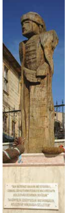
İbrahim Müteferrika Heykeli

Kendisi Macar Prensi 2. Rokoczi Ferenc'e tercümanlık yapması için bir süreliğine Tekirdağ'da bulunmuştur.