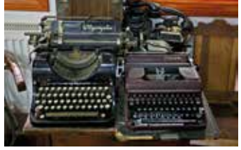
Namık Kemal Evi'nde sergilenen daktilolar