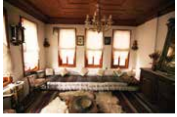
Namık Kemal Evi salon görüntüsü

19.yüzyıl Osmanlı mimarisi tarzında üç kat olarak inşa edilen bina aslına sadık kalınarak yapılmıştır.