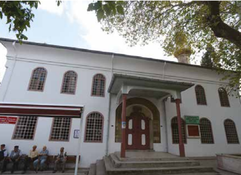
Eski Cami giriř cephesi

Bir üst kat mahfilinde, istiridye motifli mihrap niři bulunmaktadır. Mahfilin alınlık kısmı, çiçek motifleriyle bezenmiřtir. Mihrap niřinin sađ kısmında minber, sol kısmında ise vaaz kürsüsü bulunur. Caminin ön cephesinde bulunan sekizgen řadırvan, perde motifleriyle bezelidir.