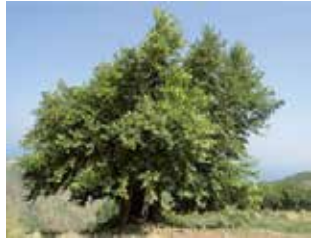
Çınar (Platanus sp.)