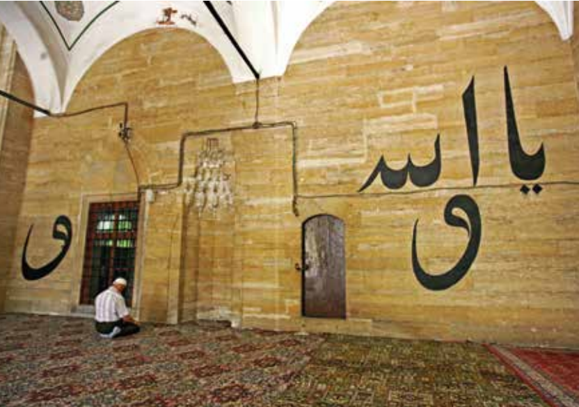
Rüstem Paşa camisinin dış duvarlarında hat yazıları