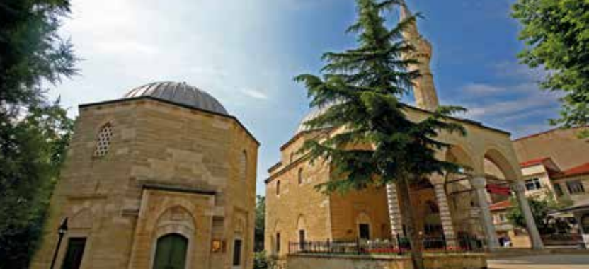
Gazi Ömer Bey Camisi (sağda) ve Türbesi (solda)

Gazi Ömer Bey Camisi Mora Fathi Turhan Bey'in oğlu olan Gazi Ömer Bey tarafından 1493/94 yılında yaptırılmıştır. Türbesi caminin yanındadır.