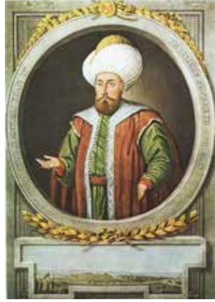
Osmanlı Padişahı 1. Murat

Osmanlı döneminde de iki önemli kent, İstanbul-Edirne yol güzergahında yer alması nedeniyle çok sayıda padişahın ziyaret ettiği bir şehirdir.