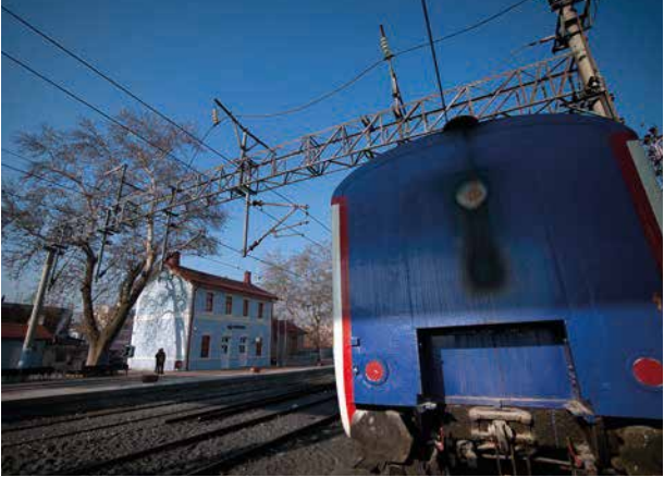
Muratlı Demiryolu İstasyonu