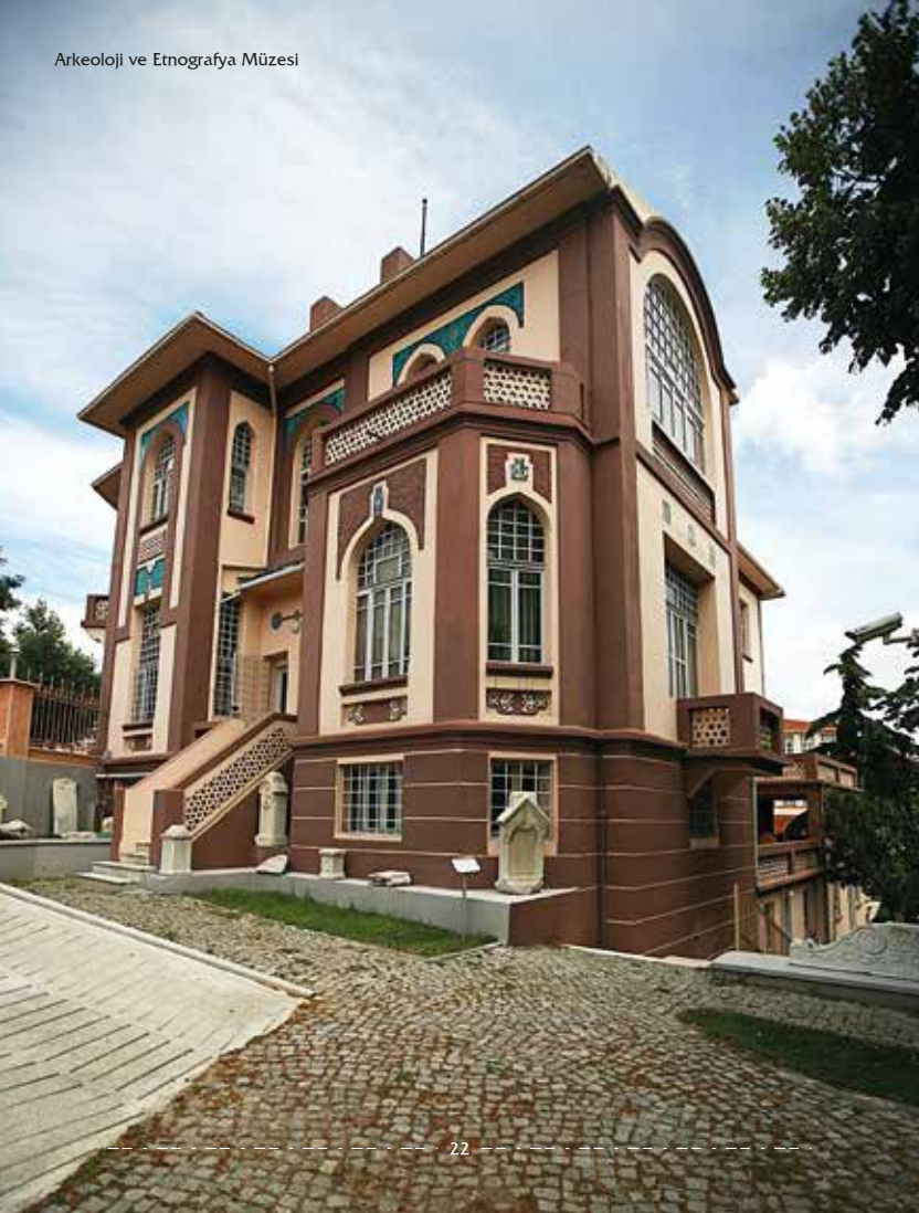
Arkeoloji ve Etnografya Müzesi

Tekirdağ Müzesi 1967 yılında, bugün Gençlik ve Spor İl Müdürlüğü'nün bulunduğu binada hizmete girmiş. 1977 yılına kadar küçük bir teşhir salonunda hizmetini sürdürmüştür. Bugünkü müze binası 1927 yılında Vali Konağı olarak inşa edilmiştir. 1977 yılında İl Özel İdaresi'nce Kültür ve Turizm Bakanlığı'na tahsis edilen Cumhuriyet dönemi ilk yapılarından olan kâgir yapı, daha sonra aslına uygun restore edilerek müze haline getirilmiştir. Tekirdağ bölgesinde bulunmuş olan tarih öncesi çağlardan günümüze kadar gelen eserler sergilenmektedir.