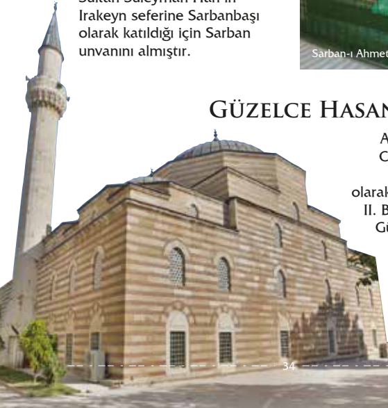
Güzelce Hasanbey Cami

Adı kayıtlarda "Ulu Cami" ve "Güzelce Hasan Bey Cami" olarak da geçmektedir. II. Beyazıt'ın damadı Güzelce Hasan Bey tarafından yaptırılmıştır.