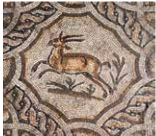
Perinthos bazilikası'nda bulunan mozaikler