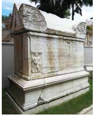
Tekirdağ Müzesi'nde sergilenen anıt mezar

Müzenin beş teraslı geniş bahçesinde Tekirdağ çevresinde bulunan Hellenistik, Roma, Bizans ve Osmanlı dönemlerine ait mimari parçalar, lahitler, mezar taşları, yazıtlar, sütunlar, heykeller, mil taşları ve kabartmalar teşhir edilmektedir.