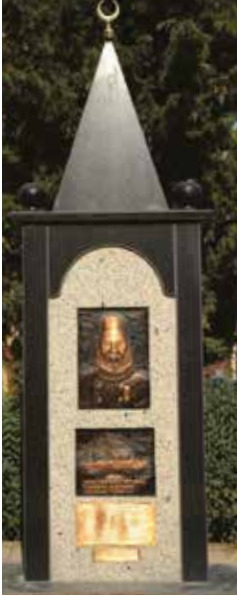
Ertuğrul Fırkateyni Parkı ve Şehit Yarbay Ali Bey Anıtı

Tekirdağ Ertuğrul Mahallesi adını, 1890 yılında iadeyi ziyaret için Japonya'ya gönderilen, Kushimoto açıklarında büyük bir fırtınaya tutularak batan, Tekirdağ'ın Dedecik köyünden Yarbay Ali'nin kaptanlığını yaptığı ve 587 denizcimizin hayatına kaybettiği Ertuğrul Fırkateyni'nden almıştır.