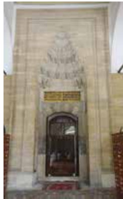
Rüstem Paşa Camisi'nin giriş kapısı