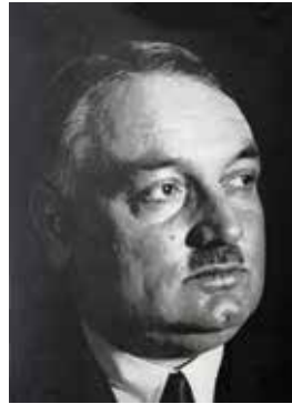
Yahya Kemal Beyatlı

Şair, yazar, siyasetçi ve diplomat olan Yahya Kemal Beyatlı 1 Mart 1935'te 5. Dönem ve 3 Nisan 1939'da 6. Dönem Tekirdağ Milletvekilliğini yapmış, Tekirdağ'a olan bağlılığını ve ilgisini şiirinde "Fetihler Ufku Tekirdağ" sözleriyle ifade etmiştir