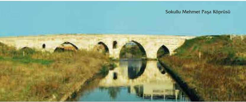
Sokullu Mehmet Paşa Köprüsü

Tekirdağ ili Çorlu ilçesinin kuzeybatısında bulunan kaleden günümüze sadece duvar kalıntıları gelebilmiştir. Kalenin yapım tarihi kesinlik kazanamamış olmakla beraber kalıntılarında 6. yüzyıla ait olduğu sanılmaktadır. Kalenin doğu ve batısı derin kuru dere yatakları ile çevrilidir. Kesme taş temeller üzerine moloz taş ve tuğladan duvarları örülmüştür.