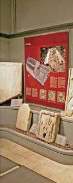
Arkeoloji müzesinde yer alan steller

Marmara Ereğlisi Yakını Toptepe Höyüğü M.Ö. 5. Bin Sonu - 4. Bin'e (Kalkolitik/ Bakırtaş Devri) ait arkeolojik kalıntıların tespit edildiği bir yerleşimdir.