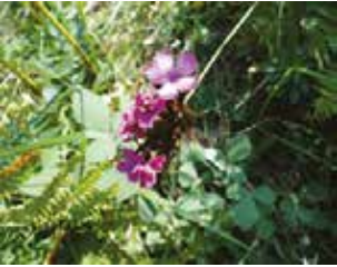
Hüsniyusuf (Dianthus ap.)