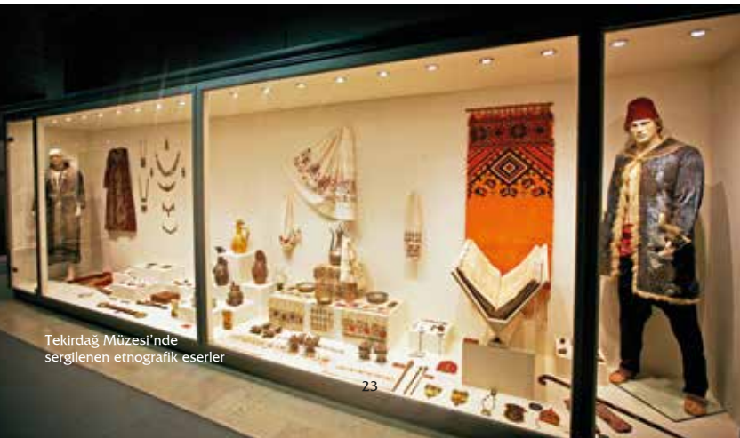
Tekirdağ Müzesi'nde sergilenen etnografik eserler

Osmanlı ve yakın dönemlerde kullanılan pişmiş toprak sırlı kaplar, ateşli ve kesici silahlar, gümüş takılar, Tekirdağ yöresi kadın ve erkek kıyafetleri, hamam takımları, el işlemleri sergilenmektedir. Karacakılavuz dokumaları ile eski Tekirdağ yatak odası teşhiri bu bölümde yer alır. Tekirdağ Odası: 19. yüzyıl ve 20. yüzyıl başlarını canlandıran bir oda iç fonksiyonlarıyla tasvir edilmiştir.