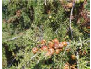
Ardiç (Juniperus sp.)