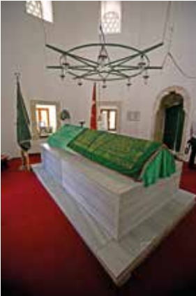
Gazi Ömer Bey Türbesi

Gazi Ömer Bey Camisi Mora Fathi Turhan Bey'in oğlu olan Gazi Ömer Bey tarafından 1493/94 yılında yaptırılmıştır. Türbesi caminin yanındadır.