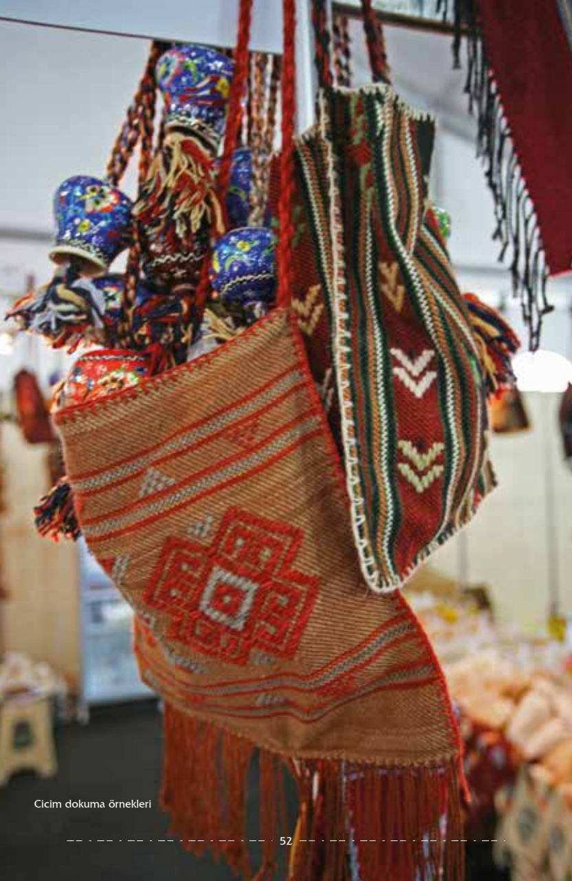
Cicim dokuma örnekleri

Tekirdağ ve çevresinde; Karacakılavuz, Ferhadanlı, Bıyıklı, Ortaca, Sağlamtaş'ta geleneksel cicim ve düz dokumalar üretilmektedir.