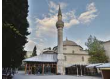
Süleymaniye Camisi'nden çeşitli görünümeler.