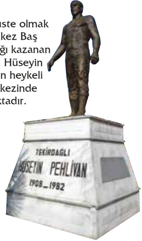
Hüseyin Pehlivan Heykeli

9 yıl üst üste olmak üzere 13 kez Baş Pehlivanlığı kazanan Tekirdağlı Hüseyin Pehlivan'ın heykeli şehir merkezinde bulunmaktadır.