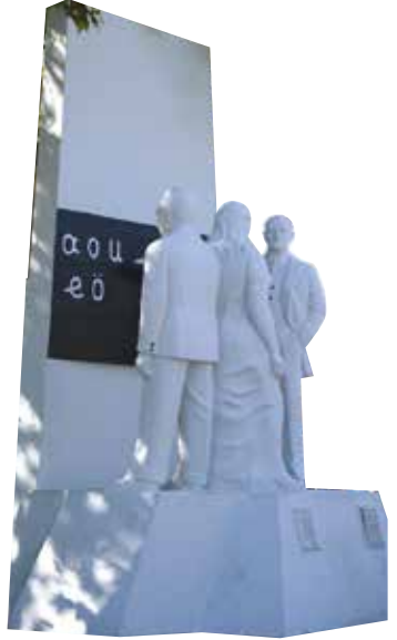
Harf İnkılabı'nı temsil eden İlköğretmen Atatürk Anıtı

Daha sonra harf devrimini başlatmak üzere 23 Ağustos 1928 Ertuğrul gemisiyle kıydan Tekirdağ'a gelmiştir. Bu ziyaretinden sonra da 3 Haziran 1936 de Göçmen Köyü inşaatını görmek üzere ve 16-17 Ağustos 1937'de de Büyük Trakya askeri manevraları incelemek için Tekirdağ'ı ziyaret etmiştir.