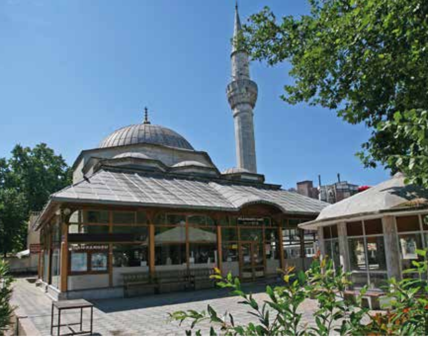
Süleymaniye Camisi giriş cephesi

Çorlu'da en önemli tarihi eserlerden biri olan Süleymaniye Camisi Kanuni Sultan Süleyman tarafından 1521'de yaptırılmıştır. İlk cemaat mekanı üç küçük kubbe ile ana mekan ise tek kubbe ile örtülüdür. İlk yapıldığında 22 odalı medresesi de bulunan bu cami, Cami-i Kebir adıyla da anılmaktadır.