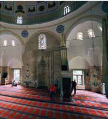
Rüstem Paşa Camisi'nin iç mekanı