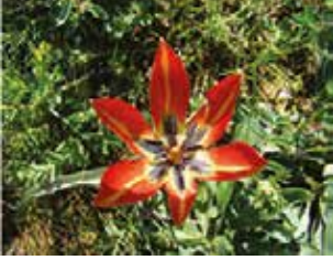
Gelincik (Paper sp.)

Ganos (Işıklar) Dağı endemik bitkileriyle botanik turizmi yapılan bir bölgedir.