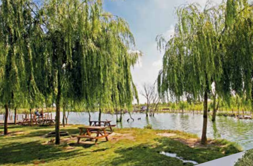
Çorlu Gölbaşı Parkı

Doğal güzellikleri ile Uçmadere ve Çorlu piknik alanı zevkle piknik yapma imkanı Saray Kastro, Şarköy ve Kumbağ plajları da yüzme imkanı sunmaktadır.