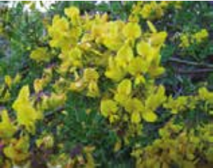
Katırtırnağı (Spartium sp.)