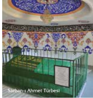
Sarban-ı Ahmet Türbesi

Kanuni Sultan Süleyman'ın emriyle 1546'da inşa edilmiştir. Hayrabolu doğumlu divan şairi Sarban-ı Ahmet, Kanuni Sultan Süleyman Han'ın Irak'ın seferine Sarbanbaşı olarak katıldığı için Sarban unvanını almıştır.