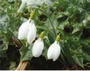
Kardelen (Galanthus sp.)