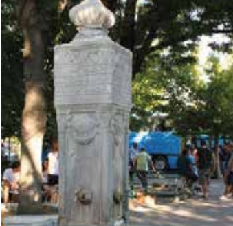
Rüstem Efendi Çeşmesi

Hicri, 1273 Miladi, 1856 tarihinde yapılmış olan bu çeşme Ertuğrul Mahallesi İskele Caddesi'ndedir.