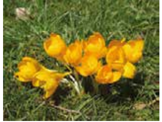
Çiğdem (Crocus sp.)