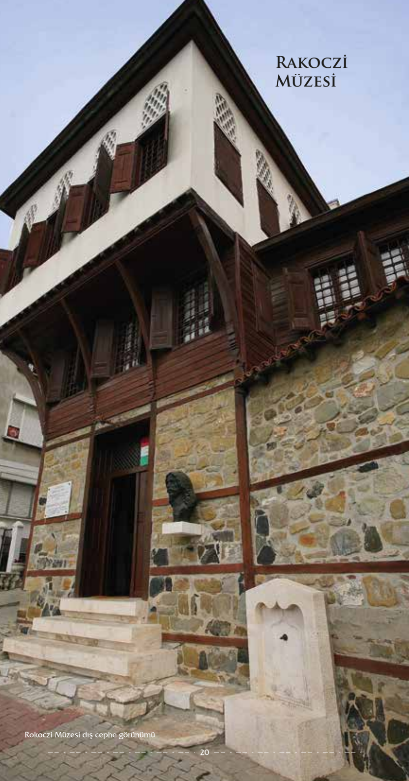
Rakoczi Müzesi dış cephe görünümü