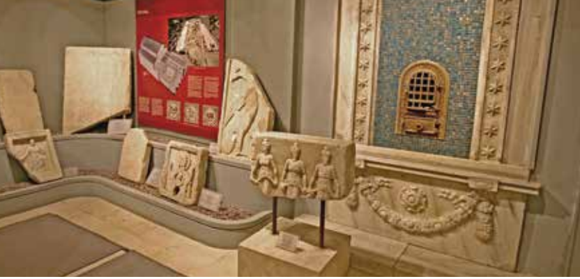
Tekirdağ Müzesi'nde sergilenen amforalar

Perinthos (Marmara Ereğlisi), Heraion Teikhos (Süleymanpaşa Karaevlialtı), Byzante (Barbaros), Apri (Karmeyan), ve Tekirdağ'ın diğer ilçe sınırları içindeki ören yerlerinde bulunmuş mezar ve adak stelleri, heykeller, heykelciklerden oluşan ayrıca Naip ve Hareket Tepe Tümülüslerinin tüm buluntuları da aynı salonda sergilenmektedir.