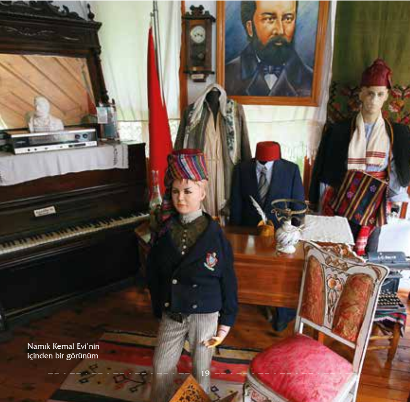
Namık Kemal Evi'nin içinden bir görünüm