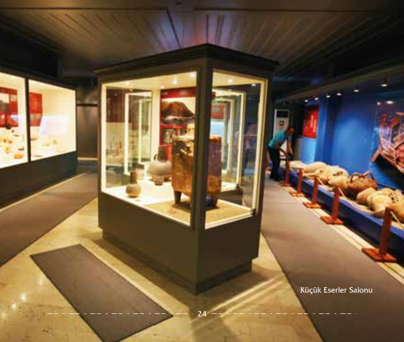
Küçük Eserler Salonu

Tarih öncesi çağlardan Bizans dönemine kadar olan süre içinde yapılmış olan eserlerden pişmiş toprak Ana Tanrıça şeklindeki kabı, günlük kullanım kapları, krater ve amphoralar, madeni heykelcikler, kaplar, mızrak uçları, ok uçları, fibulalar, cam ve taş takılar, koku şişeleri, süs eşyaları ile madeni paralar sergilenmektedir.